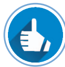
Gestión de Políticas Borrado o mantenimiento de Metadatos